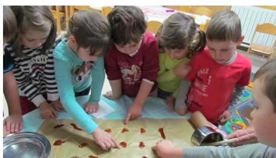
Prvošolci in dan slovenske hrane