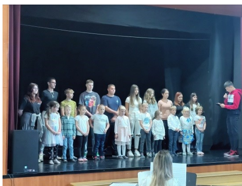
Učenci 1. in 9. razreda

petjem in plesom so sklenili ta slovesen dogodek, posladkali pa so se še s torto.