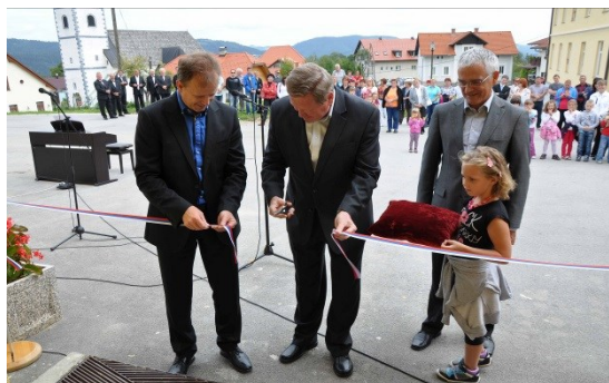
Slavnostno odprtje prenovljene šole