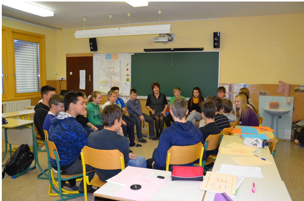
Razredna ura v 8. in 9. razredu