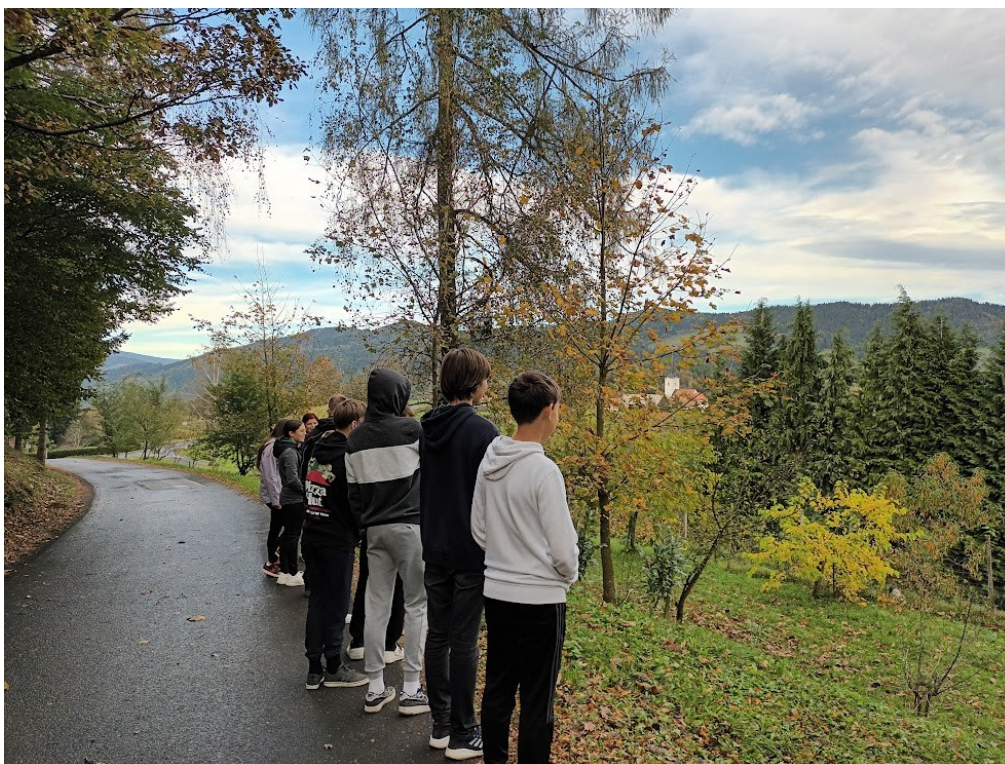
Pogled na Remšnik