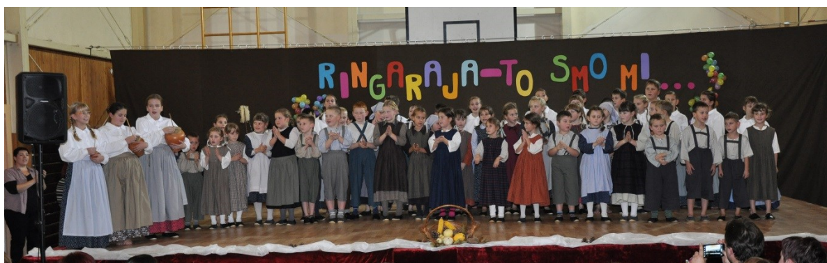
Večer ljudske glasbe, plesa in igre