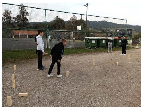
Zabavna igra vikinški šah

Zjutraj smo vstali, se uredili in zajtrkovali. Nato smo se odpravili v muzej mineralov, ki jih najdemo samo v okolici Remšnika. Zatem smo dokončali naš prototip in naredili reklamo zanj. Posneli smo namreč videoposnetek, v katerem smo se tudi zahvalili, da smo lahko prišli. Spoznali smo veliko novih prijateljev in hrana je bila odlična.