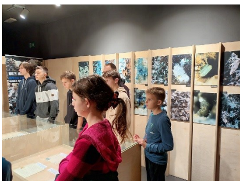
V muzeju mineralov