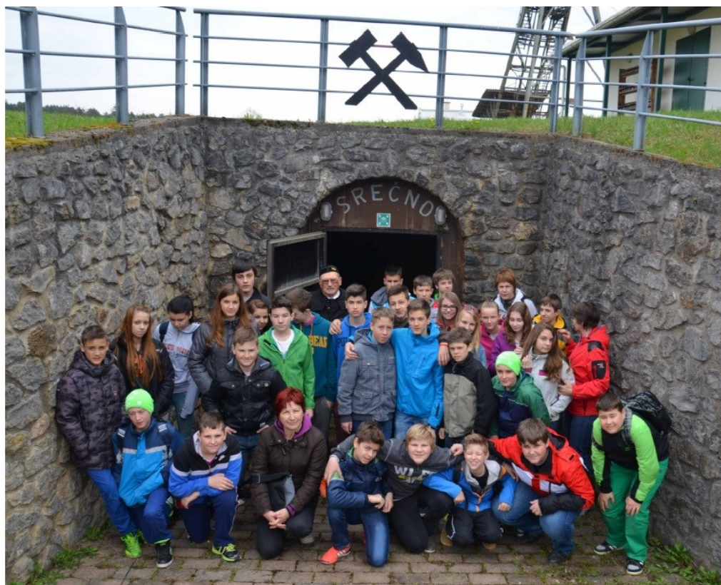
Šola v naravi (pred rudnikom Kanižarica v Črnomlju)